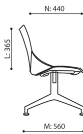
SH 22X 1N