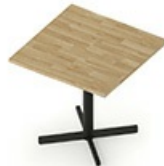
TB CS 80