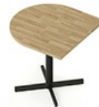
TB CSC 80