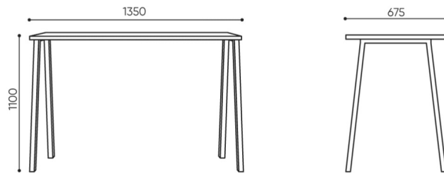
OT 4L AH

Wagi dla stolików z blatem z płyty laminowanej. Weights for tables with laminated board top. Gewichte für Tische mit Laminatplatte. Poids pour les tables avec plateau en stratifié.