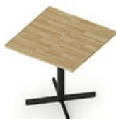
TB CS 80