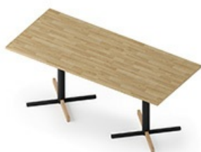
TB CR 180 + W