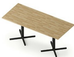
TB CR 180